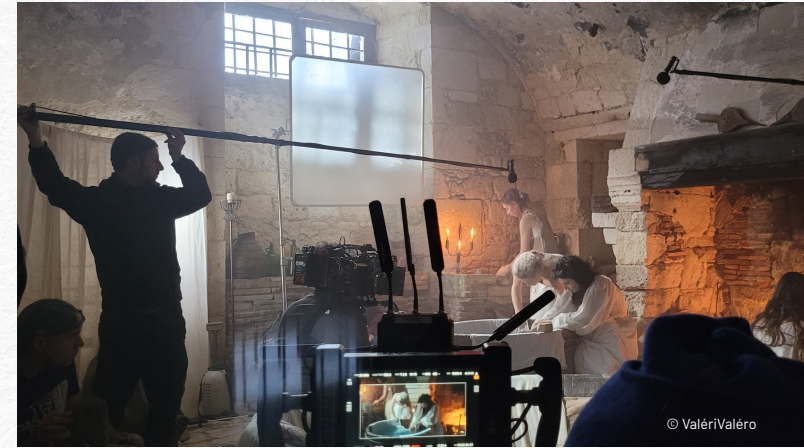
Décor Salle d'eau sur le tournage d'Olympe, une femme dans la Révolution réalisé par Julie Gayet et Mathieu Busson / production : MSVP

Tout en gardant le café à portée de main !