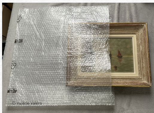
Un même format peut servir pour différents objets

Moins on emballe, plus on gagne de temps et moins on jette de papier bulle, moins on achète, moins on pollue!