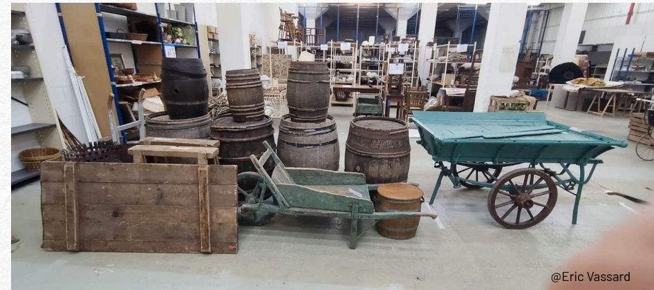
Espace stockage 800m 2 au Studio de la Montjoie sur la série Nourrices / Lincon TV,

Sans base organisée, l'ensemblage devient chaotique = trajets supplémentaires, heures supplémentaires et gaspillage