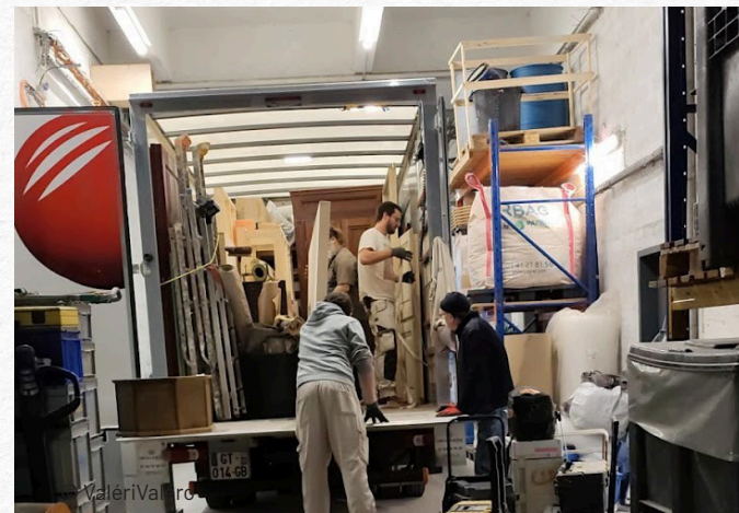
Equipe de ripeurs au Studio de la Montjoie sur la série Nourrices

Un objet qui aura plusieurs vies, évitera un objet produit demain.