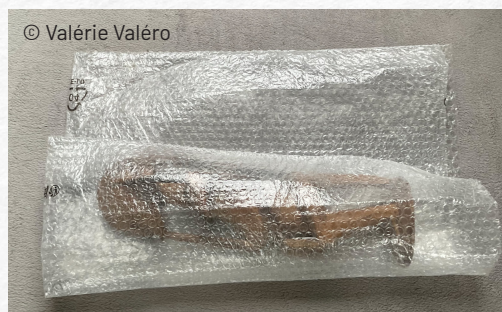
Emballage rapide, sans découpe ni scotch